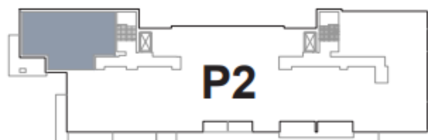
USYTUOWANIE MIESZKANIA W BUDYNKU