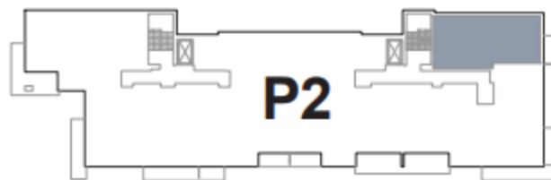
USYTUOWANIE MIESZKANIA W BUDYNKU